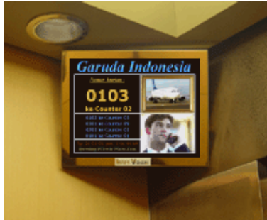
Display / Monitor di dinding