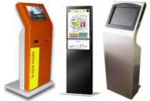
Touch Screen + Kiosk